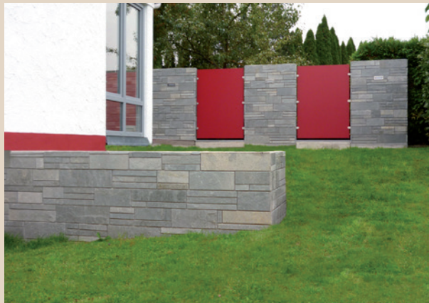
Die Gestaltungsmöglichkeiten sind groß. Böschungsmauern, Sichtschutzwände, Hochbeete und vieles mehr lassen sich mit betongebundenen Natursteinvorsätzen und in Kombination mit anderen Materialien.