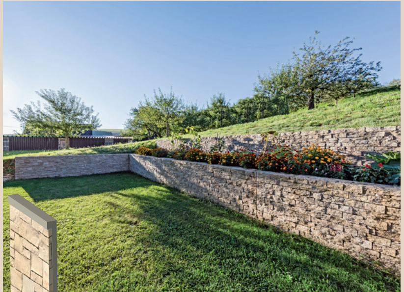
Die betongebundenen Natursteinwände mit der Bezeichnung starwalls sind sicher wie Stahlbeton und zugleich ästhetisch wie Natursteinmauern. Hier eine Lösung mit dem L zur Hangseite.

Weitere Informationen: www.glatthaar-starwalls.de